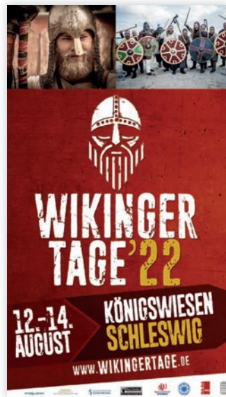
WIKINGER TAGE SCHLESWIG