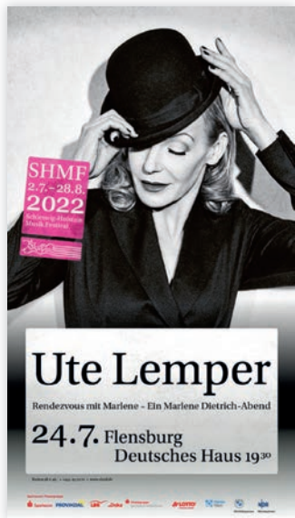
SH MUSIK FESTIVAL